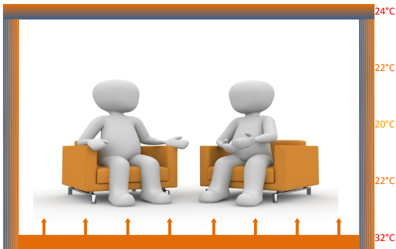
Luftheizung, wie heute üblich